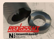
Esempio di tubo ad altissima rigidità

Reglass H.T. (www.reglass-ht.com) si è affermata negli anni '90 sostenendo i propri clienti nell'introduzione di rulli in composito su macchine per la produzione di carta, plastica e tessuti tecnici... Per garantire il valore dei propri prodotti, l'azienda ha sviluppato una filiera produttiva specializzata e verticalizzata.